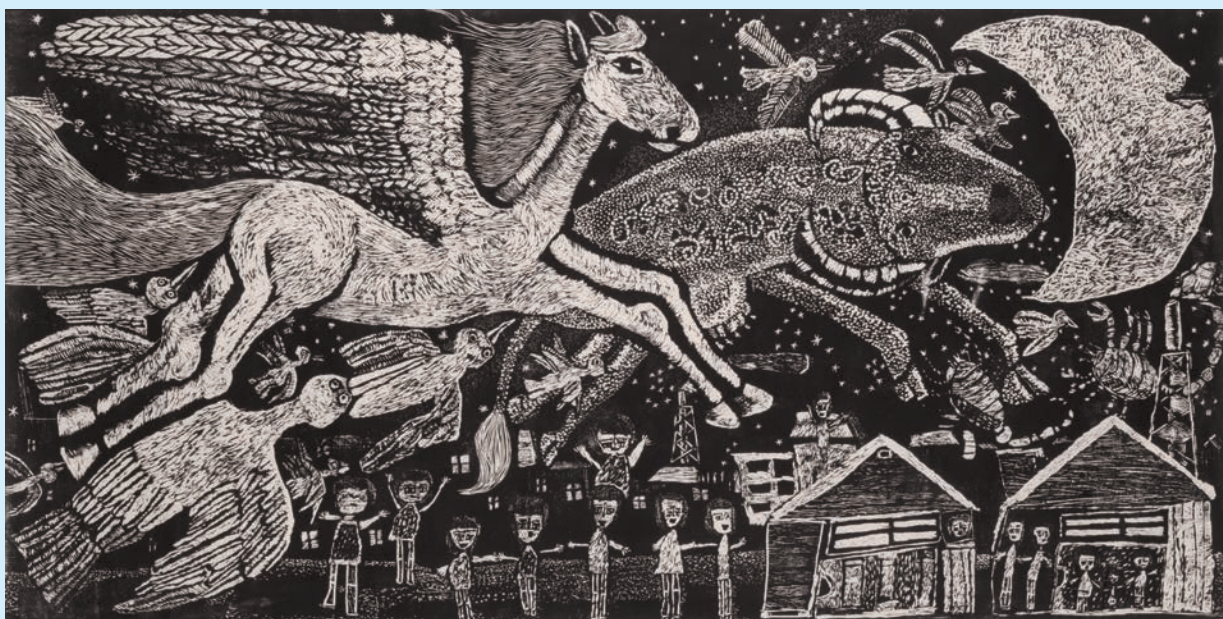
八戸市立湊中学校養護学級生徒《星空をペガサスと牛が飛んでいく》『虹の上をとぶ船総集編II』1976