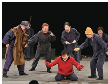
昨年度のステージより